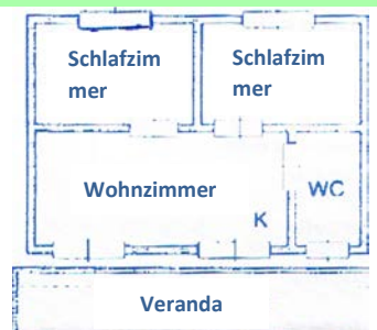
BUNGALOW IN MASSIVBAUWEISE Dreiraum 4 Betten: 60

Die Ruhezeit muss von 24:00 bis 07:00 Uhr und von 14:00 bis 16:00 Uhr eingehalten werden.